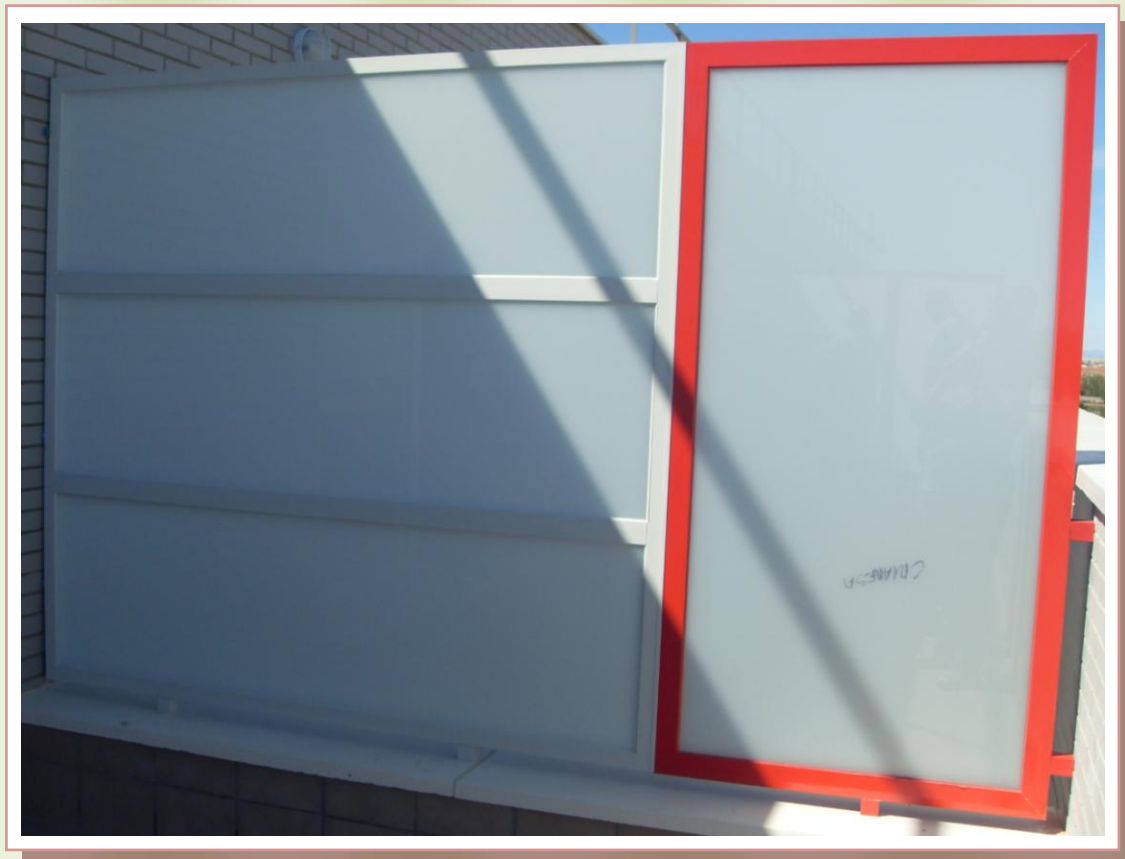
Pantalla de separación entre terrazas de planta ático