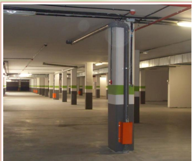
Planta Sótano 2